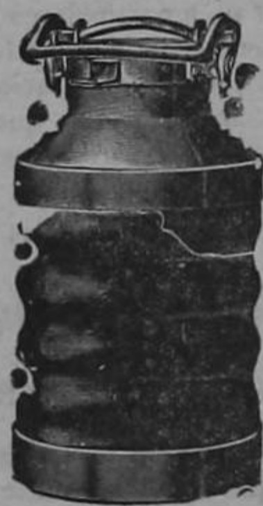
Almacenes al por mayor